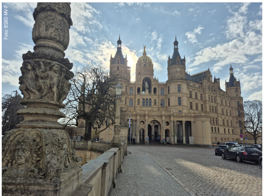
Das Schweriner Schloss, Sitz des Landtags M-V